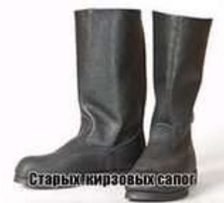
Старых кирзовых сапог